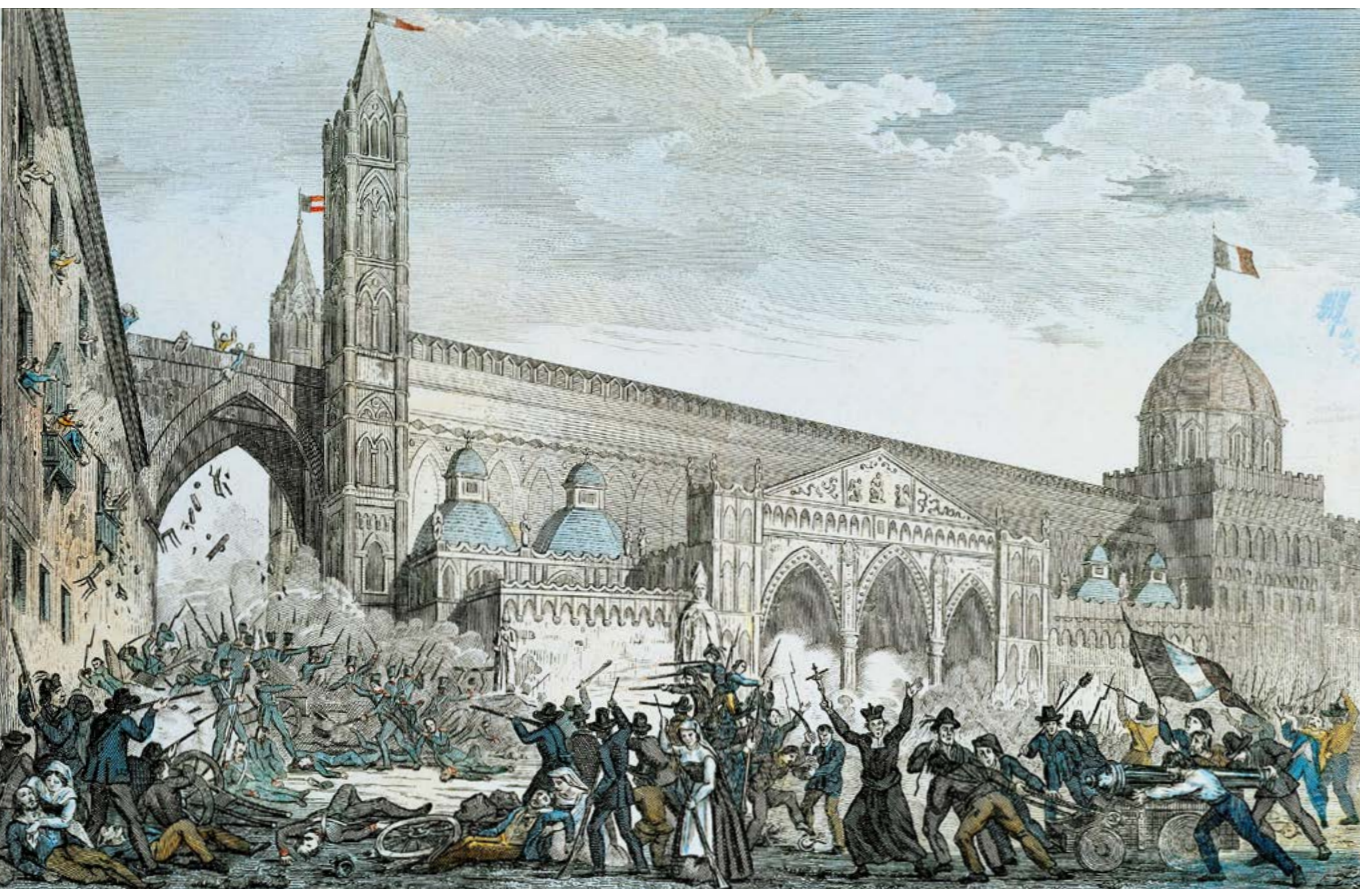
Aufstand in Palermo am 12. Januar 1848, Künstler: Nicola Sanesi (1850), © akq-images, Nr. AKG 1687478

Habsburgermonarchie vor allem als Negativfolie für eine teleologisch strukturierte Erzählung politischer Moderne, die zwangsläufig auf ihrem langen Weg nach Westen im Nationalstaat endet. 9