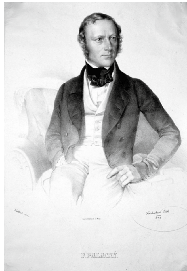
František Palacký (1798-1876), Lithografie von Josef Kriehuber (1843)