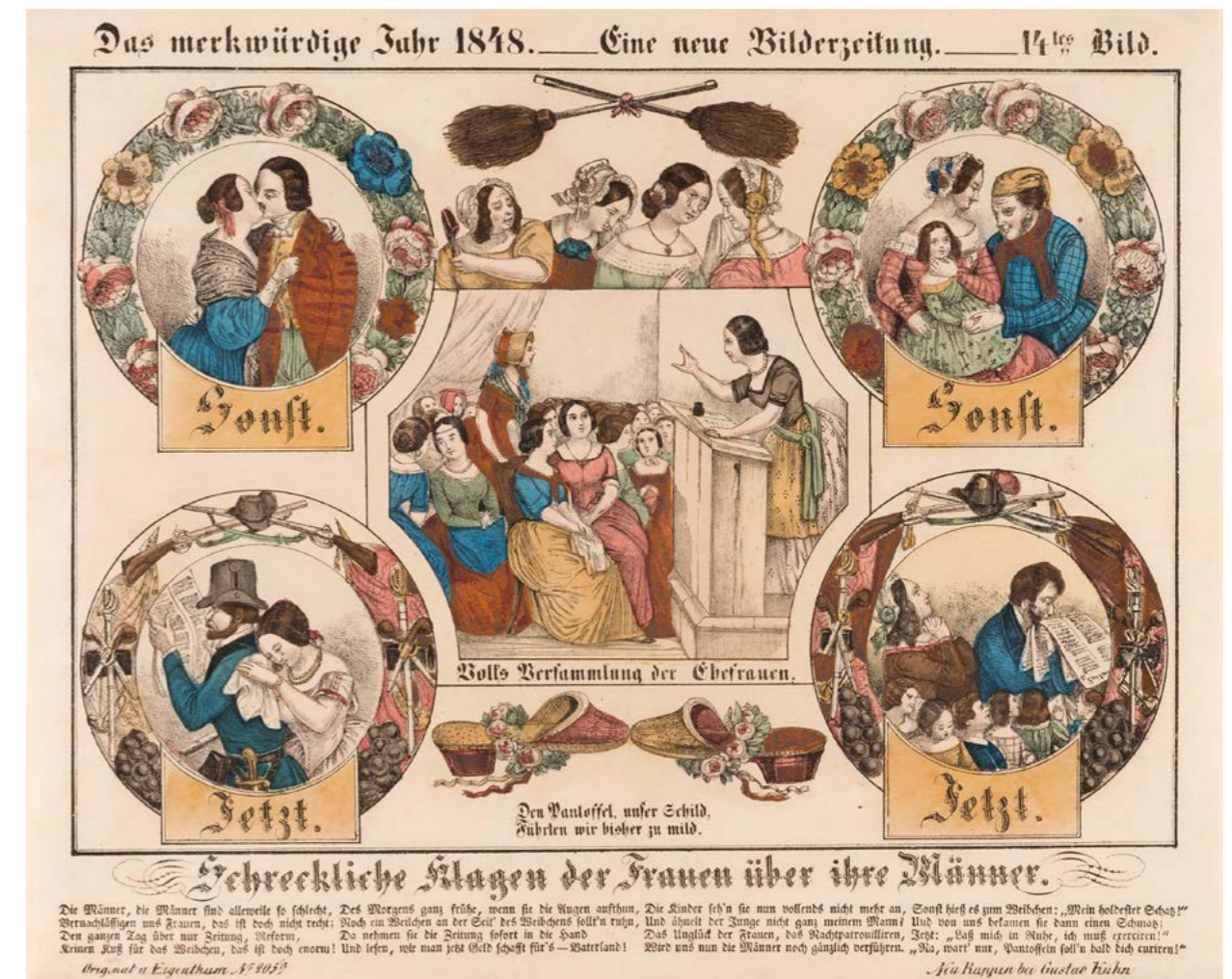
„Schreckliche Klagen der Frauen über ihre Männer“ Gustav Kühn, Lithographie 1848.