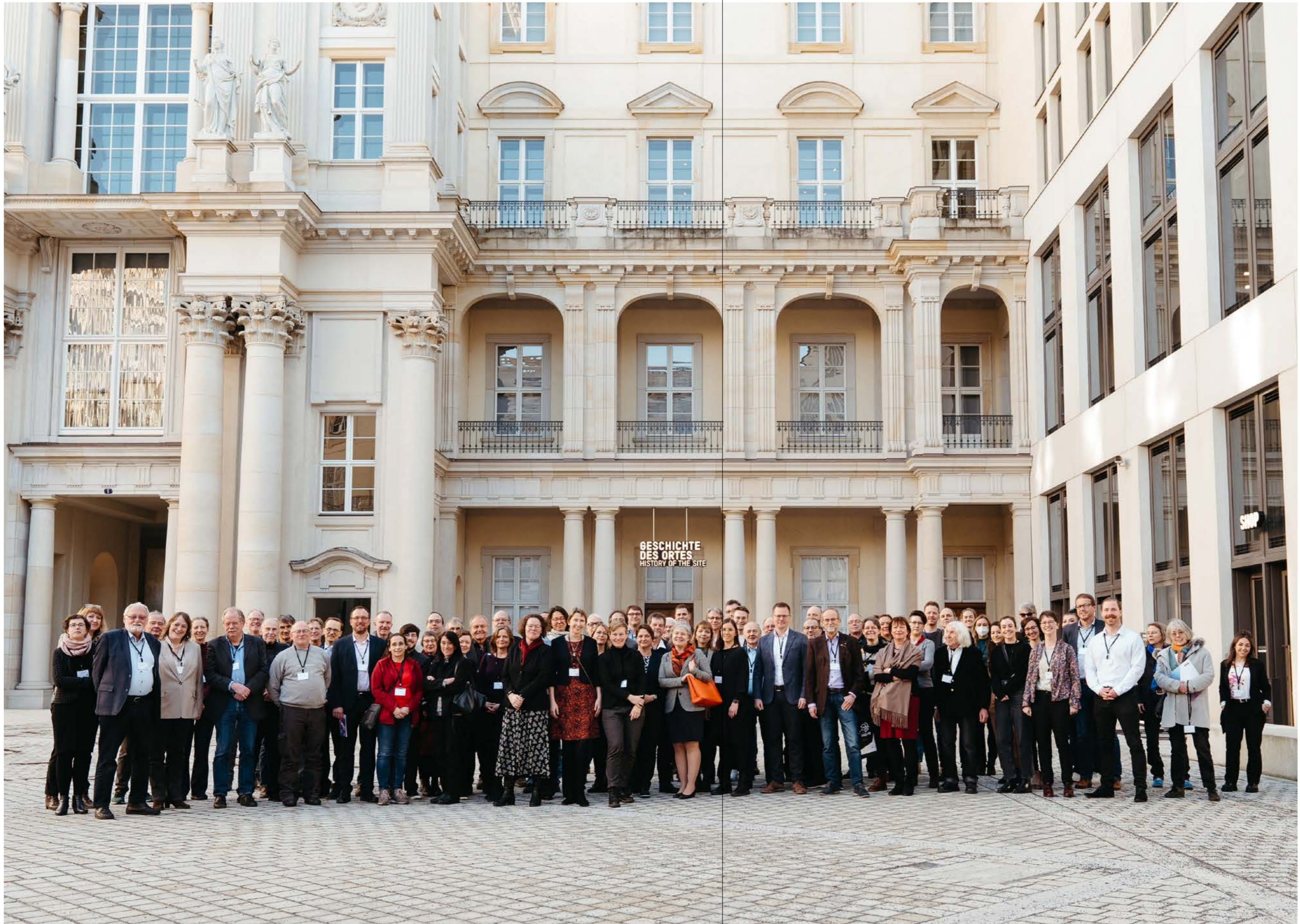
Die Teilnehmer:innen und Referent:innen der Europäischen Jahrestagung im Berliner Humboldt Forum