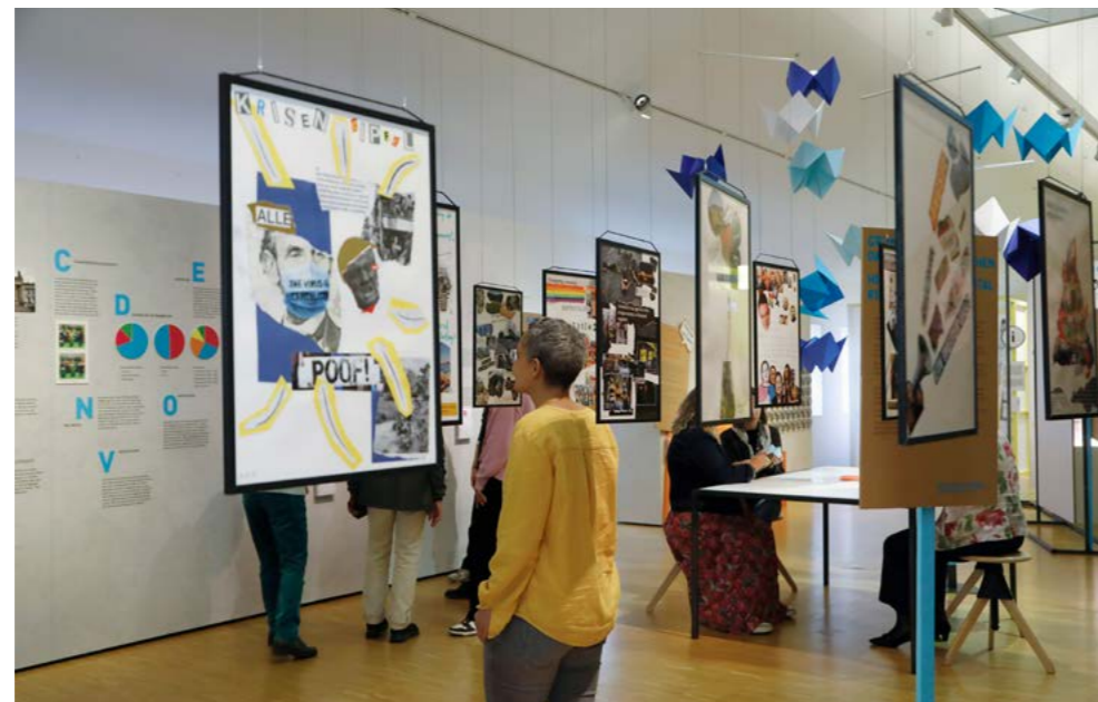
In der Stadtlabor-Ausstellung „Demokratie: Vom Versprechen der Gleichheit“ sind vielfältige Beiträge von Frankfurter Bürger:innen zu sehen.