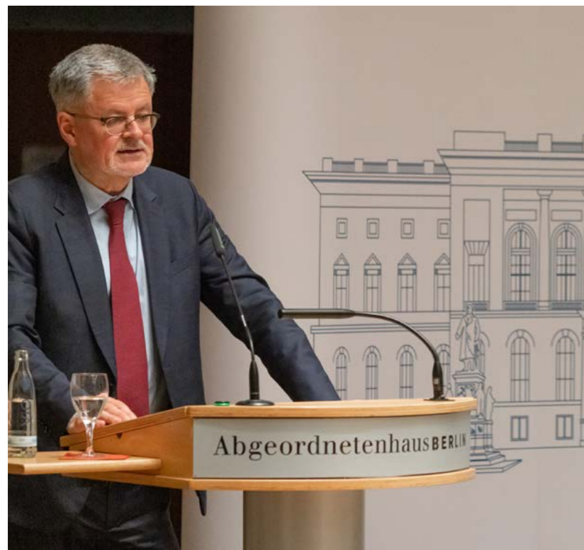
Sir Christopher Clark, Festrede im Abgeordnetenhaus von Berlin, am 16. März 2023

Aufgeregte Berliner strömten auf die Straßen, um mehr über die Vorgänge zu erfahren. Lesezirkel, Kaffeehäuser und sonstige öffentliche Einrichtungen waren zum Bersten gefüllt. „ Wer ein frisches Blatt zuerst in die Hand bekam, “ schrieb ein Augenzeuge, „musste auf einen Stuhl steigen und den Inhalt laut vorlesen“. Die Menschenmassen flossen wie Blut durch die Arterien der Innenstädte. Die Emotionen, die dann möglich wurden, bildeten ein Gemeingut, aus dem jeder schöpfen konnte. „ Die ganze Welt hätte ich umarmen können, “ schrieb ein Berliner Student, „und jedem zurufen: Nun werden wir auch frei! “ [...]. „ Endlich fiel es mir wie Schuppen von den Augen, um mich sah ich eine neue, mir fremde Welt! Ich hörte das Herzklopfen der Menschen, ich erkannte ihre Gedanken [...]. “ Für politisch denkende Europäerinnen und Europäer waren diese Frühlingstage ein allumfassender Moment gemeinsamer Erfahrung. Sie machten alle zu Zeitgenossen