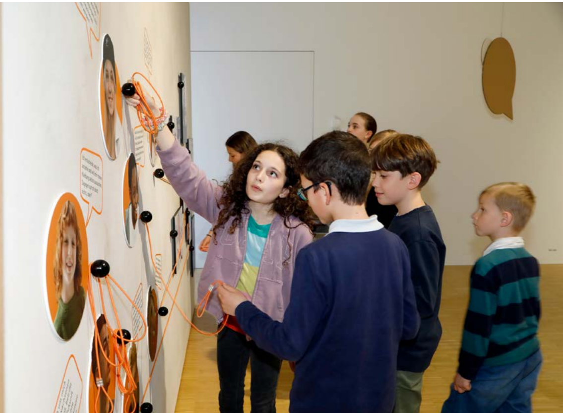
An Hands-on Stationen können Kinder spielerisch über verschiedene Kinderrechte diskutieren.