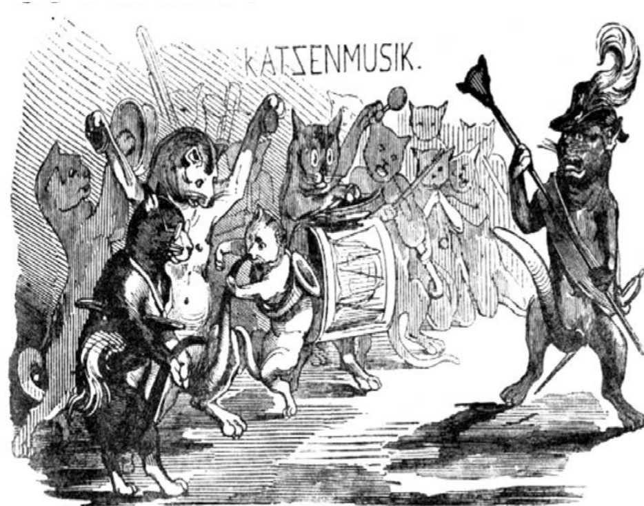
Ohrenbetäubende „Katzenmusiken“ oder „Charivaris“ waren eine beliebte Protestform, mit der Angehörige der Unterschichten ihren Missmut über politische Prominenz oder städtische Honoratioren zum Ausdruck brachten. © gemeinfrei/Wikimedia Commons, Titelblatt „Wiener Katzen-Musik“ vom 26. Oktober 1848, Ausgabe 107

sie haben Alle nur ein Interesse, die Befreiung aus den Fesseln der Geldherrschaft, sie haben Alle einen Unterdrücker, und das macht sie gleich und vereinigt sie, sie müssen insgesamt ihn stürzen, denn keiner von ihnen kann frei sein, wenn es nicht Alle sind.“ 8